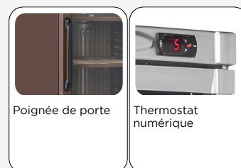
Poignée de porte